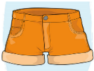
These are shorts _____