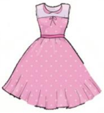
This is a skirt. _____